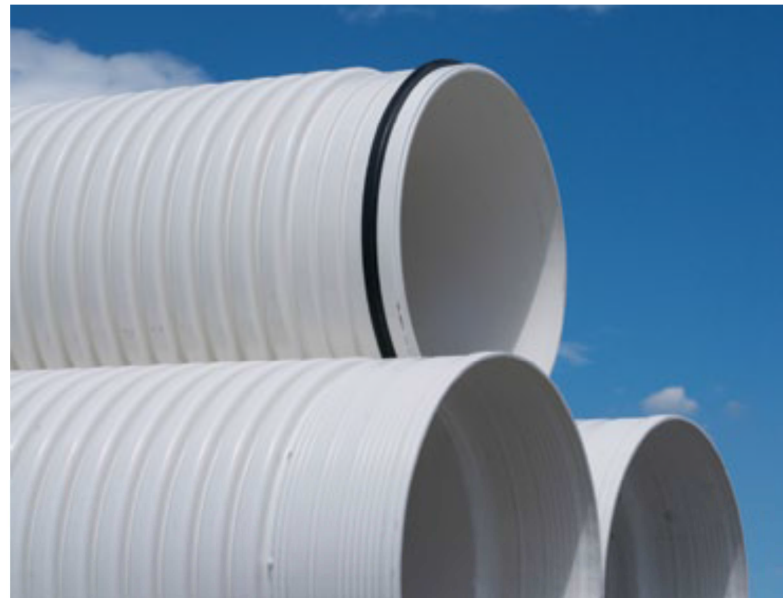
Tubería TDP AASHTO M 304